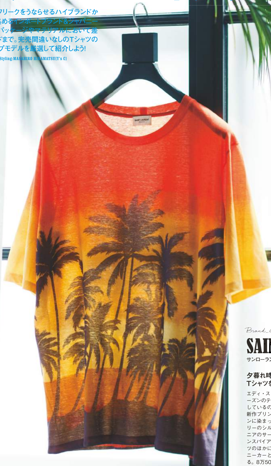
Styling:MASAHIRO HIRAMATSU(Y's C) Text:KIYOTO KUNIRYO(INO-TECH)

世界のファッションフリークをうならせるハイブランドから、絶大なる支持を集めるインポートブランド&ジャパニーズブランド、さらにはパッケージやマテリアルにおいて差別化を見せるブランドまで。完売間違いなしのTシャツのみ、今シーズンのトップモデルを厳選して紹介しよう!