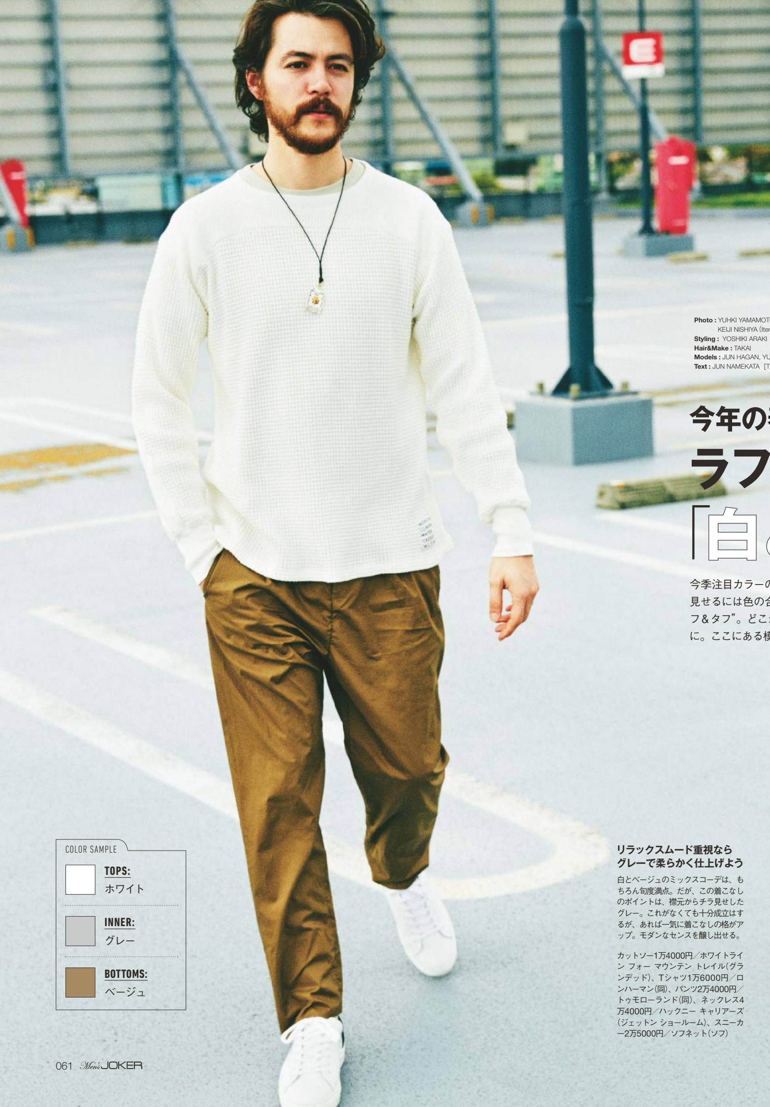
Photo: YUHKI YAMAMOTO (Model) KEIJI NISHIYA (Item) Styling: YOSHIKI ARAKI [The VOICE] Hair&Make: TAKAI Models: JUN HAGAN, YUTA ASANO Text: JUN NAMEKATA [The VOICE]