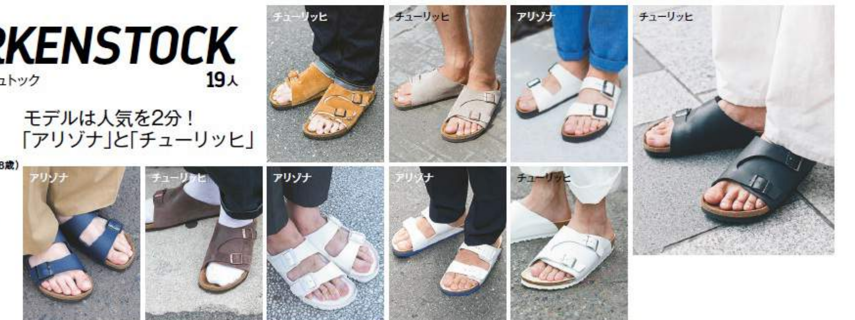
【京都】 岩谷洗太郎さん(28歳) アパレル グルカパンツをメインにしつつネイビーで統一感を出した。サンダル/ビルケンシュトゥック、シャツ/アナトミカ、ボトムス、プレスレット/ウィンテージ