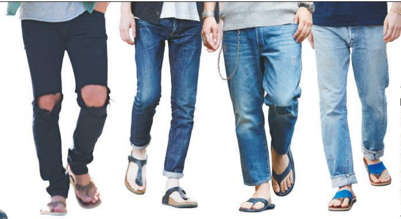
【東京】 佐野賢太さん(35歳) バッグデザイナー サンダル/レインボーサンダル、Tシャツ/シュガーライダー、ジーンズ/ホワイトラン、バッグ/アノニムクラフツマンデサイン、サングラス/オークリー