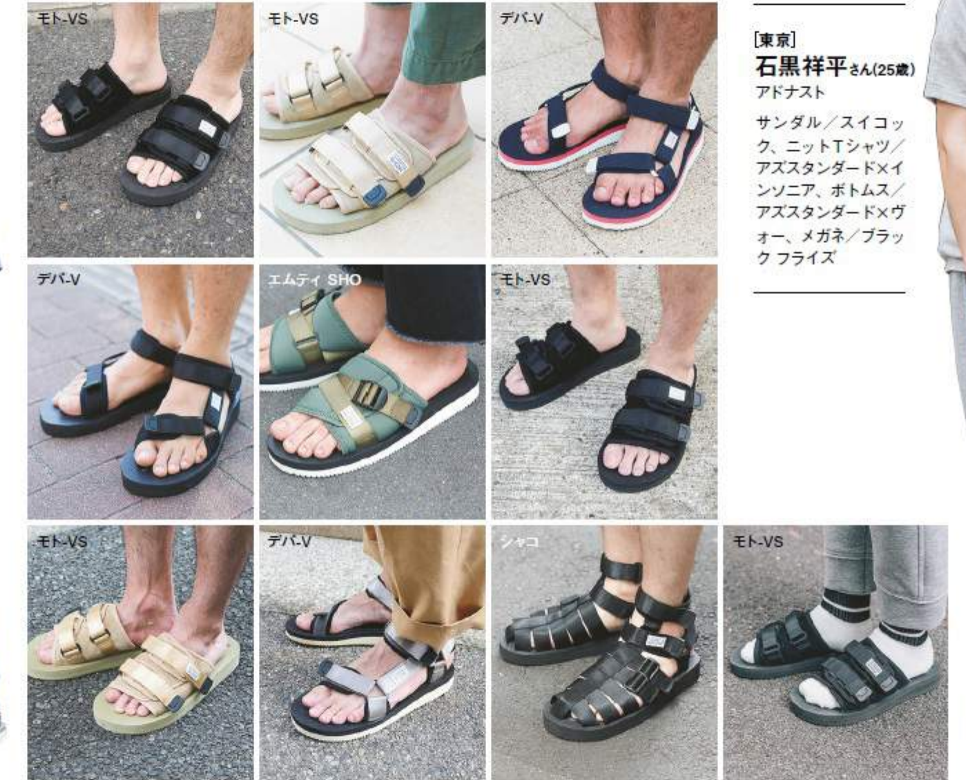
【東京】 石黒祥平さん(25歳) アドナスト サンダル/スイコック、ニットTシャツ/アズスタンダード×インソニア、ボトムス/アズスタンダード×ヴオー、メガネ/ブラックフライズ